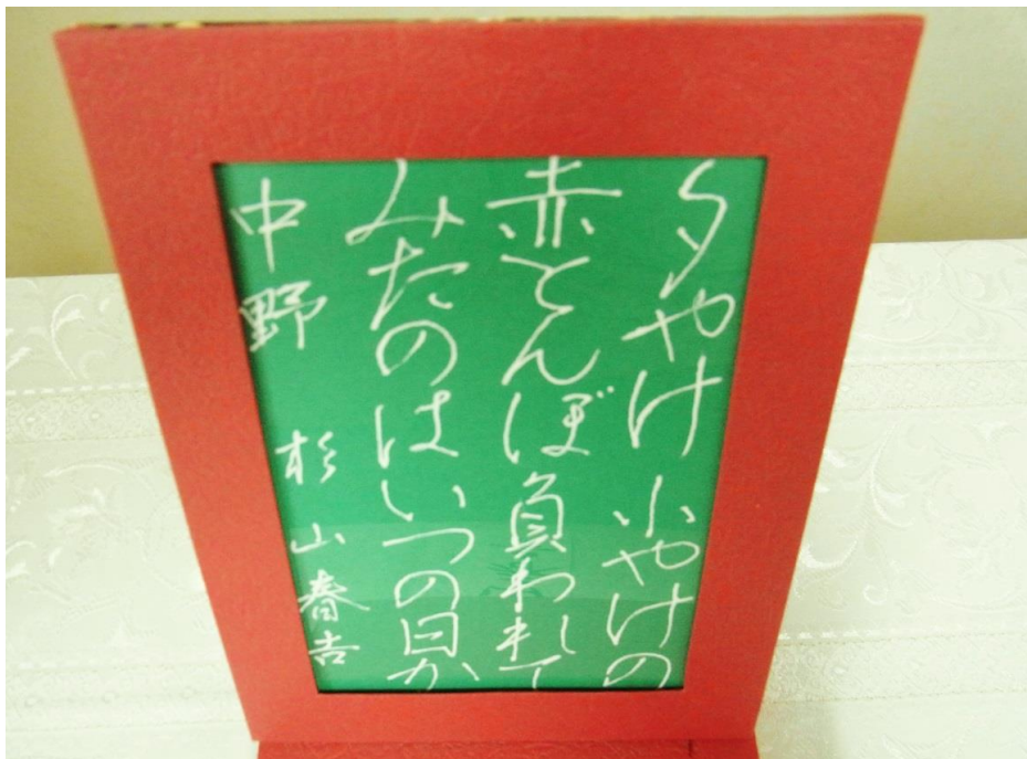
緑の台紙に白いインク？で書いたのかな？ 筆記用具はどんなものなのでしょう か？