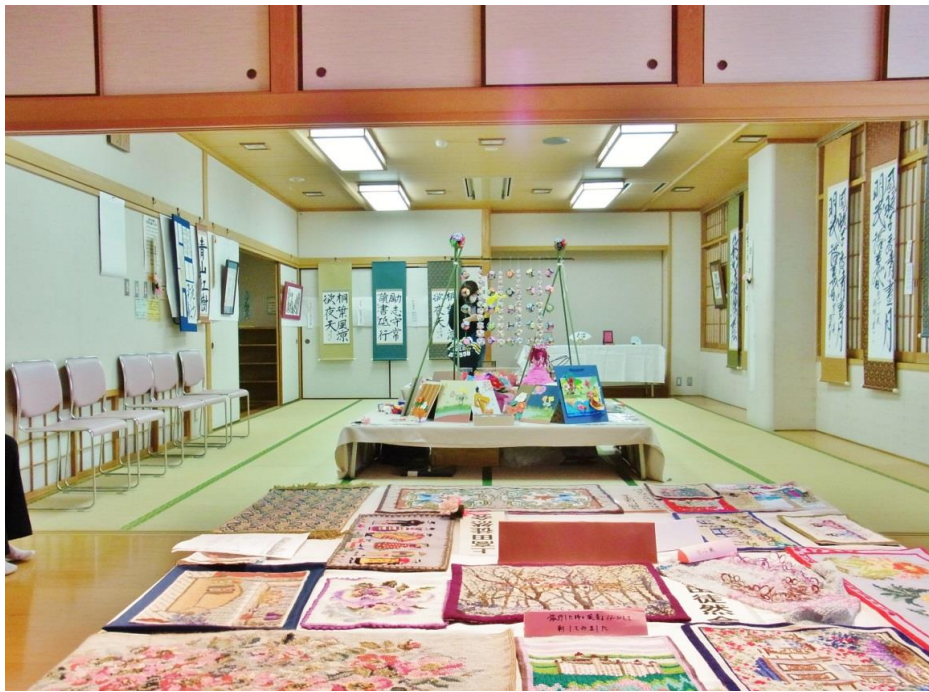
会場は和室1号と2号をつなげてあります。