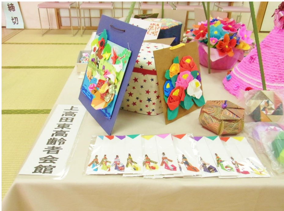
高齢者会館を利用している皆さんの作品もありました。